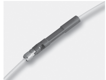
Krokodil Spleisseinheit (Faserversion) basiert auf 1.25mm Krokodil Ausführung