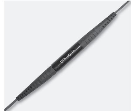
Krokodil Spleisseinheit (Kabelversion) basiert auf 2.5mm Krokodil Ausführung