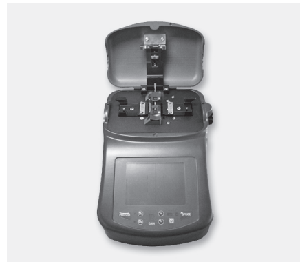
ZEUS D50 Fusion Spleißgerät