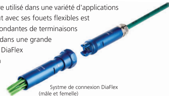
Système de connexion DiaFlex (mâle et femelle)

Le connecteur DiaFlex est polyvalent et peut être utilisé dans une variété d'applications grâce à ses caractéristiques. La version Fan-Out avec ses fouets flexibles est typiquement intégrée dans les versions correspondantes de terminaisons de câble 19" (Patchpanel) et peut être utilisée dans une grande variété d'applications différentes. Les Fan-Out DiaFlex sont utilisés dans toutes les applications où un connecteur flexible est requis ou si les interfaces ne sont pas encore connues au début de l'installation.