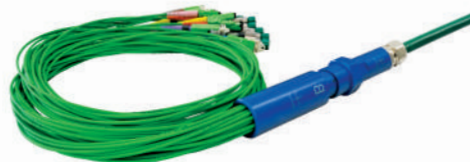
Fan-Out flexible IP68

Un oeillet de tirage peut remplacer le Fan-out temporairement, afin de permettre l'insertion du DiaFlex dans un tuyau ou une canalisation existante. Le Fan-out muni des fouets peut ensuite être installé sur le DiaFlex.