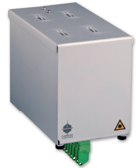
flexModul Box - Frontseiten Ansicht