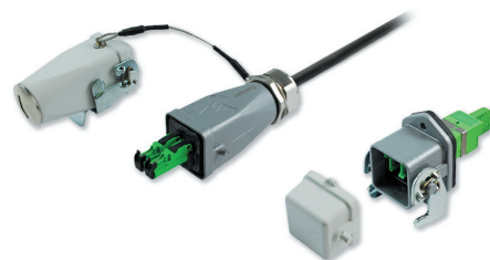
Connecteur revos E-2000® et Bulkhead, 2 canaux optiques